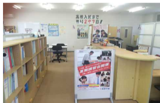
きれいに掃除、整った教室内は勉強スペースとして最適!!

一10年になります。小学生から高校生まで担当しています。教科は主に英理数を教えています。