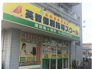
近隣には、小学校・中学校もあり、通塾に、自習に非常に通いやすく便利な立地!!

大好きなバンド、Mr.Childrenの『終わなき旅』の歌詞の一部です。何事も全てが順調に進むことはないと思います。途中にある様々な障害物を見て見ぬふりをしたり、楽な方へ傾いたり、そこから逃げ出したくなる時にこの歌詞を思い出すと、乗り越えた分だけ自身が成長できる!と、前向きになれる。